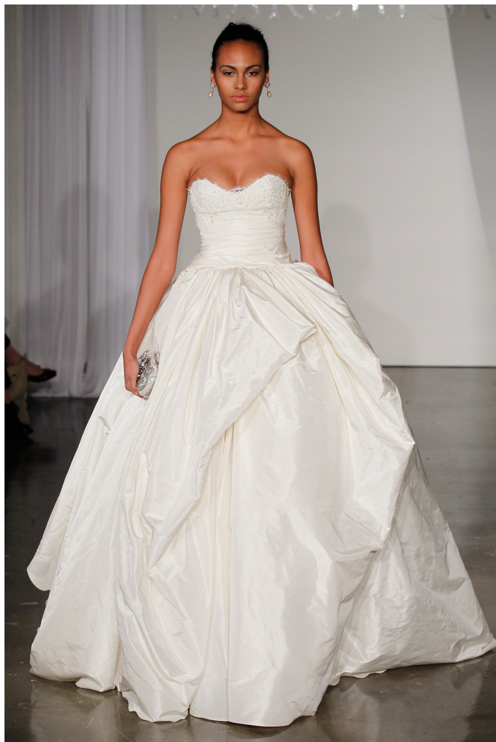
Her ses sweetheart neckline på en kjole med korset og et fyldigt drapret ball gown snit i matte overflader.