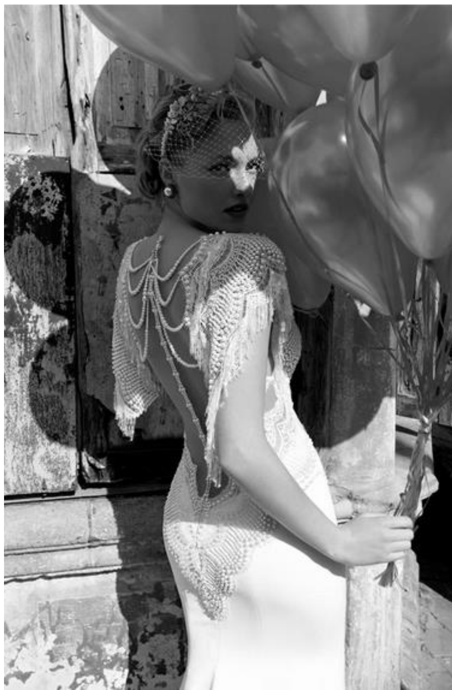
Her ses den dybe ryg prydet med perler, knapper og blonder på en kjole med en slim silhuet.